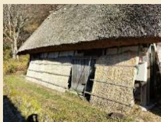
* オダレを設置した合掌造民家