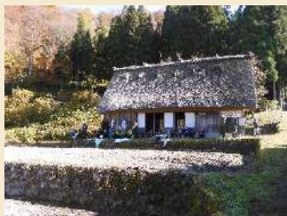
* 2日集合場所 白川郷合掌文化館(旧松井家)

2024年冬の白川郷で、今回作るオダレが合掌造民家を守り、景観の一部になります。